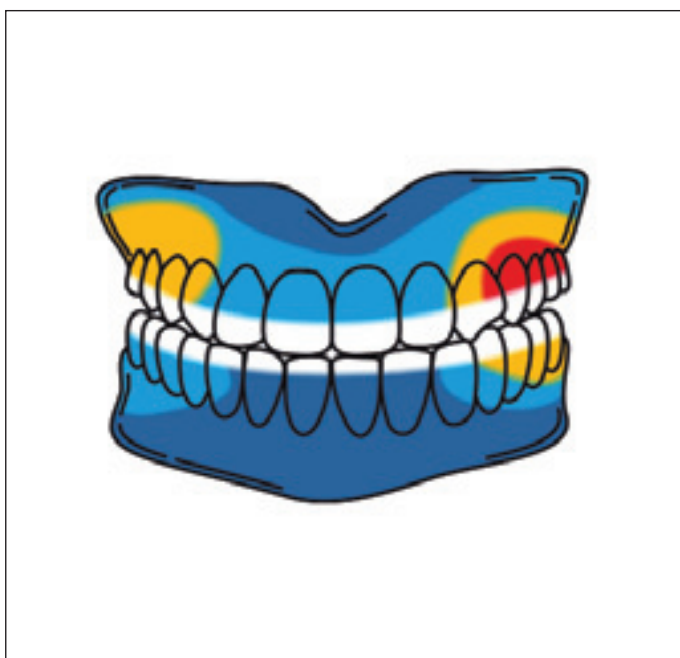
Obr. 2. Nejčastější lokalizace bolesti u perzistující idiopatické dentoalveolární bolesti, ilustrativní schéma podle údajů Miura et al. [28] (komentář v textu).

Fig. 2. Most common pain locations in persistent idiopathic dentoalveolar pain, illustrative depiction based on data from Miura et al. [28] (commentary in the text).