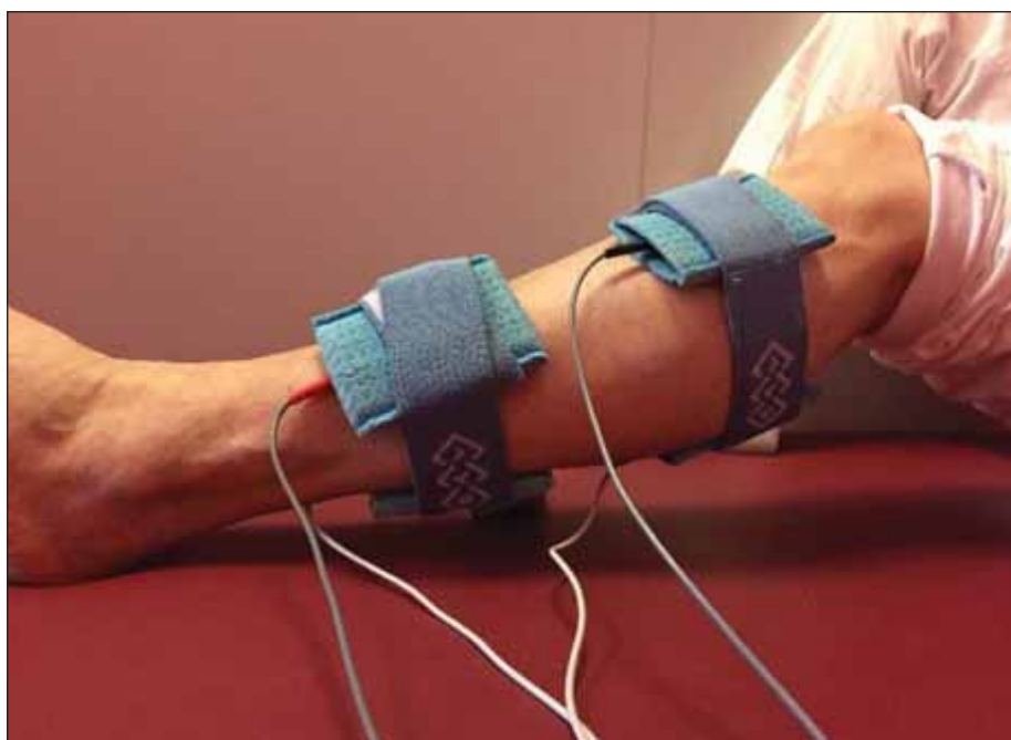
Obr. 1. Aplikace elektrické stimulace dle Jantsche – pro lepší zobrazení uložení elektrod s flexí kolenního kloubu.

Fig. 1. Application of electrical stimulation according to Janstch – the leg is positioned to a slight flexion in the knee joint for better visualization of electrode placement.