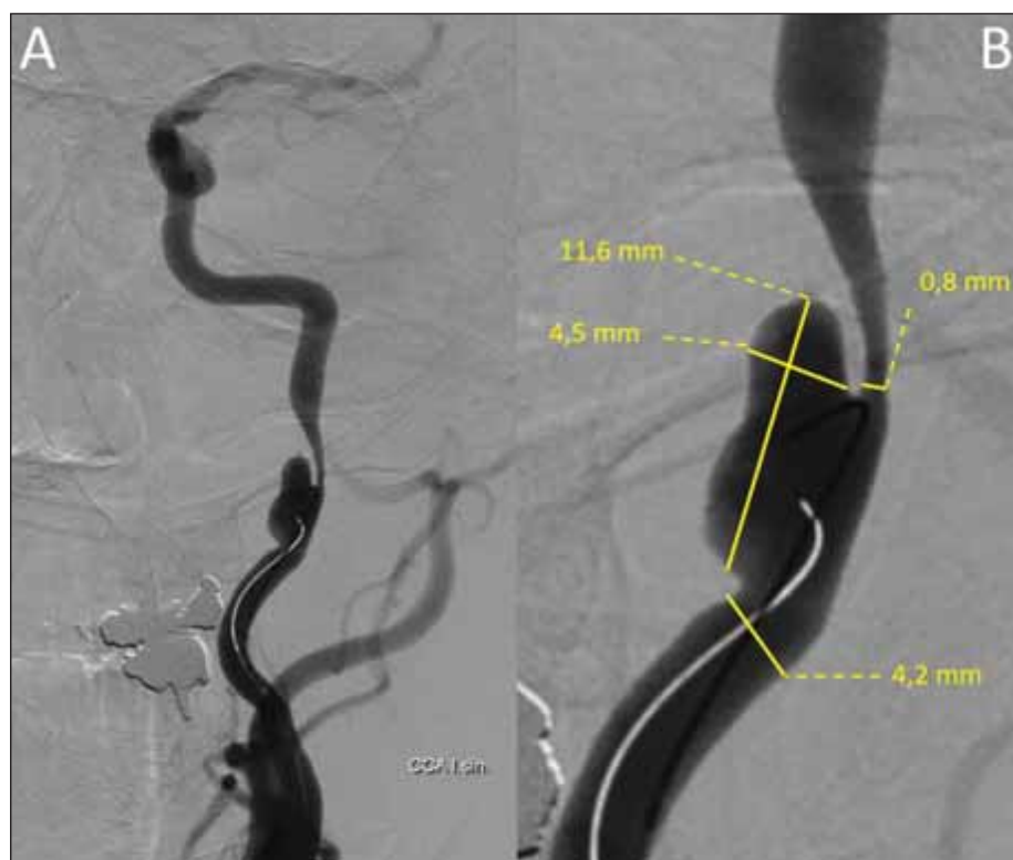
Obr. 1. D gitální subtrakční angiografie provedená z a. carotis communis vlevo znázorňující disekující aneuryzma a. carotis interna vlevo o velikosti 11,6 × 4,5 mm působící nejméně 80% stenózu.

Symptomy se nejčastěji rozvíjí do 12 h od zákroku [4], ale jejich výskyt je možný i měsíc po výkonu. CHS je charakterizován pulzující jednostrannou frontotemporální nebo periorbitální, někdy i difúzní bolestí hlavy, zvracením, poruchou vědomí, makulárním edémem a poruchou zraku, fokálními motorickými epileptickými záchvaty s častým sklo-