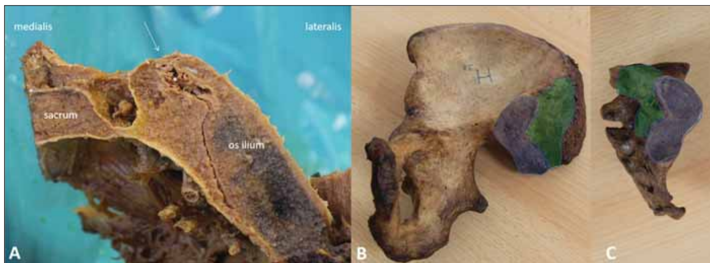
Obr. 1. Anatomický preparát articulatio sacroiliaca – (A) na transversálním řezu; (B) pohled na kloubní plochy os coxae; (C) kloubní plochy os sacrum.

Pacient leží v pronační poloze na vyšetřovacím lehátku. V některých případech je výho-