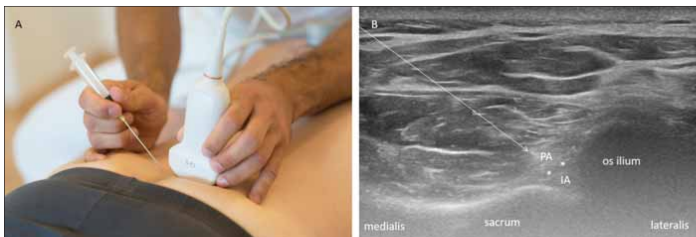
Obr. 4. Ultrasonograficky navigovaný léčebný obstřik sakroilického kloubu technikou direct in-plane. (A) Pronační poloha pacienta na vyšetřovacím lehátku, směr inzercce jehly je mediolaterální; (B) část léčebné směsi je aplikována intraartikulárně (IA) a část periartikulárně (PA).

Bílé hvězdičky, ligg. sacroiliaca dorsalia; bílá přerušovaná šipka, trajektorie jehly.