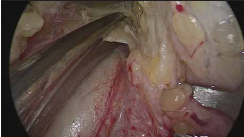
Obr. 4. Vazivové pruhy kryjící nervus ulnaris jsou protnuty. Fig. 4. Fibrotic bands covering the ulnar nerve are divided.