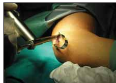
Obr. 3. Zavedení endoskopu s integrovaným reaktorem do proximální podkožní kapsy. Fig. 3. Retractor integrated endoscope is introduced into the proximal subcutaneous pocket.

tivně sledovaného souboru popsalo 90 % pacientů zlepšení či dokonce výrazné zlepšení. Jako stacionární hodnotilo svůj stav 9 % a jako zhoršený 1 % z operovaných. U těchto 10 % pacientů byl stav spojen buď s pooperační luxací nervu, double crush lézí nebo těžkým vstupním nálezem (McGowan III). Kontrolní EMG s tříměsíčním odstupem od operace absolvovalo 137 pacientů. U 89 % z nich byl pooperační elektrofyziologický nález hodnocen jako zlepšený, u 10 % jako stacionární a u 1 % ( n = 2 ) došlo ke zhoršení. Obě tato zhoršení byla přechodná a při další EMG s odstupem 10, resp. 15 měsíců od operace bylo prokázáno zlepšení bez nutnosti operační revize, a to i vzhledem ke zlepšenému klinickému stavu. Podezření na iatrogení lézi MACN bylo vysloveno u dvou pří-