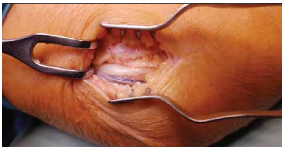
Obr. 2. Nervus ulnaris v sulcus nervi ulnaris humeri. Fig. 2. Ulnar nerve at the level of the medial epicondyle of the humerus.

(obr. 5). Po dokončení rozsáhlé dekomprese loketního nervu povolujeme tlak v manžetě, čímž před suturou rány zajistíme odhalení případného krvácení a jeho následnou pečlivou stázu. Výkon zakončujeme suturou podkoží a kůže, ke které využíváme kosmeticky výhodný intradermální steh (obr. 6). V případě peroperačního nálezu luxace či subluxace dekomprimovaného nervu nebo při lokální patologii (např. ganglion) v blízkosti průběhu nervu lze přistoupit k jeho transpozici s endoskopickou asistencí. V těchto případech však i my preferujeme konverzi na klasickou otevřenou techniku s mírným rozšířením řezu.