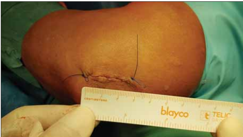
Obr. 6. Sutura malé incize (2–3 cm) pomocí intradermálního stehu. Fig. 6. Suture of the small incision (2–3 cm) using the intradermal technique.

( p = 0,20 , resp. 0,84 ). Naopak byl prokázán silný vztah mezi subjektivním návratem síly operované ruky po operaci a návratem citlivosti ( p < 0,05 ). Stejně tak byl prokázán silný statistický vztah mezi spokojeností pacientů a návratem senzitivity ( p < 0,05 ) a zlepšením síly úchopu ( p < 0,05 ).