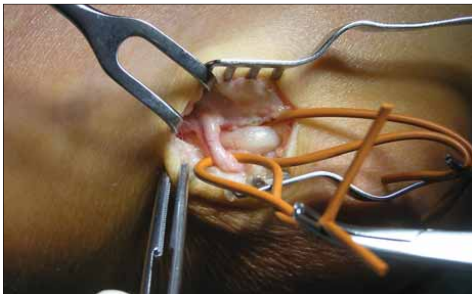
Obr. 1. Větev nervus cutaneus antebrachii medialis přebíhající přes nervus ulnaris. Fig. 1. Branch of the medial antebrachial cutaneous nerve crossing the ulnar nerve.