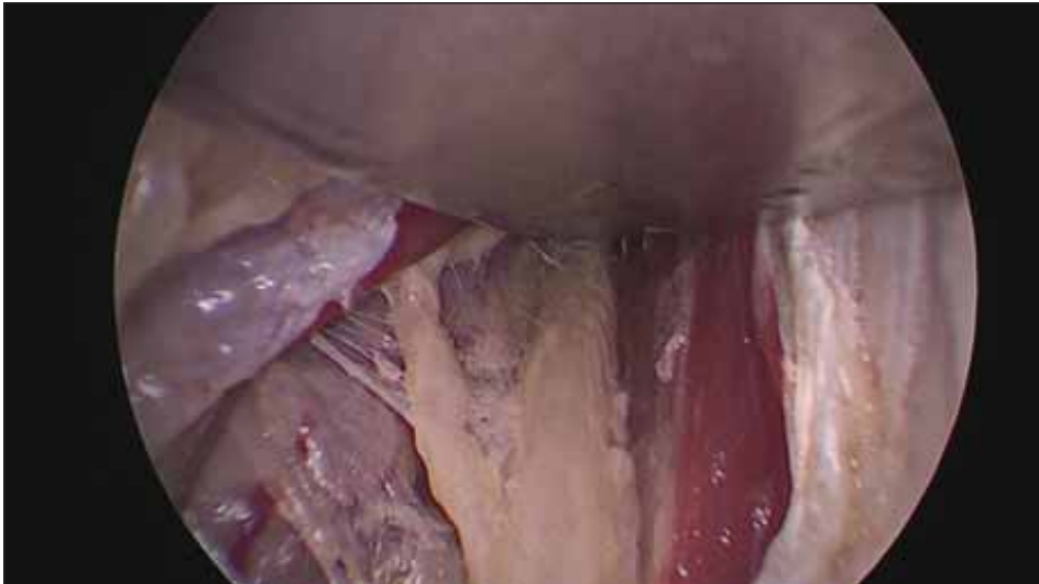
Obr. 5. Odstupující nervová větev pro musculus flexor carpi ulnaris. Fig. 5. Branch of the ulnar nerve for the flexor carpi ulnaris muscle.