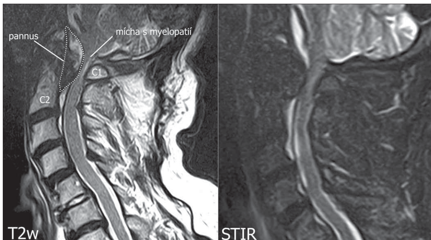
Obr. 1. MR. (A) Sagitální T2 vážené skeny, tečkovaně vyznačen pannus; (B) sagitální STIR skeny s patrnou kompresí míchy s myelopatií. Skeny z 1,5T MR přístroj Toshiba Vantage ZGV (Tokio, Japonsko).