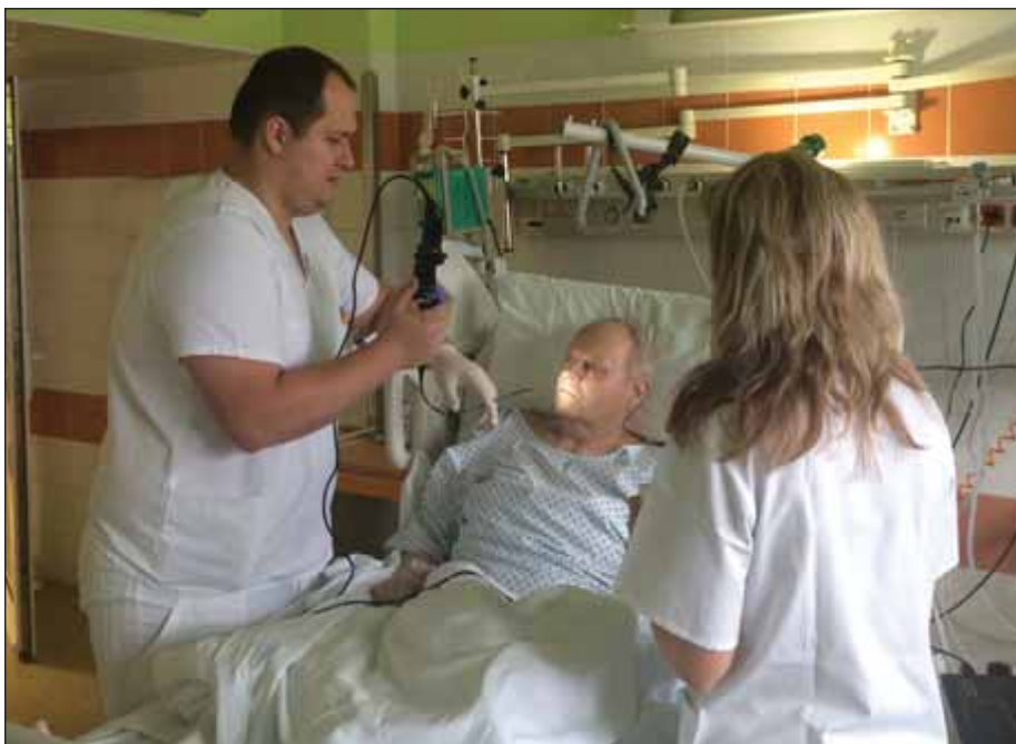
Obr. 1. Flexibilní endoskopické vyšetření polykání na neurologické jednotce intenzivní péče – neurolog a klinická logopedka.

Pacient byl vyšetřován minimálně v polosedě na lůžku, musel být schopen spolupráce. Nosní dírkou mu byl zaveden endoskop, bylo provedeno základní anatomické a neurologické zhodnocení orofaryngeální oblasti, následně bylo hodnoceno polykání slin, logopedkou podaného pyré, tekutiny a pevného sousta se zaměřením na detekci penetrace, aspirace nebo tiché aspirace. Pro zlepšení přehlednosti byly tekutina a pyré obarveny rozdílnými potravinářskými barvivy. Eventuální průnik/neprůnik materiálu do dýchacích cest byl hodnocen klinickou logopedkou a neurologem jednak přímo během výkonu a poté z videozáznamu pomocí Rosenbekovy penetračně-aspirační škály (PAS) (tab. 1) [11]. Supervizi při hodnocení výkonů prováděl ORL speci-