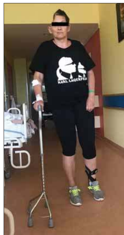
Obr. 2. Pacientka po dekompresivní kraniectomii vpravo pro maligní hemisferální infarkt. Modifikovaná Rankinova škála 3 – pacientka zvládá chůzi s oporou čtyřbórové berle.

Je tedy na místě standardizace objektivního klinického a grafického nálezu u pacientů s maligním hemisferálním infarktem napříč zainteresovanými odbornostmi daných iktových center, resp. komplexních cerebrovaskulárních center, tak, aby