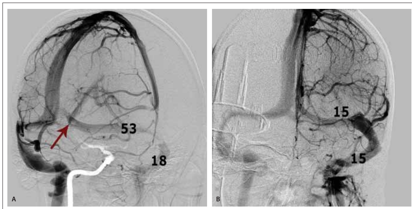
Obr. 2. DSA žilních splavů – (A) šikmá projekce s atypickým vyústěním s. rectus do levého s. transversus (šipka) a stenózou přechodu levého s. transversus a s. sigmoideus včetně měřených tlaků (v mmHg) v pre- a poststenotickém úseku splavu; (B) stav po dilataci stenózy a zavedení stentu s vyrovnáním tlakového gradientu.

Fig. 2. Venous sinuses DSA – (A) oblique projection showing an atypical drainage of sinus rectus into the left transverse sinus (arrow) and the stenosis between the left transverse and sigmoid sinuses with the corresponding pressure readings (in mmHg) in the pre- and post-stenotic segments respectively; (B) post-interventional stenosis dilation with stent in situ and with pressure equalization.