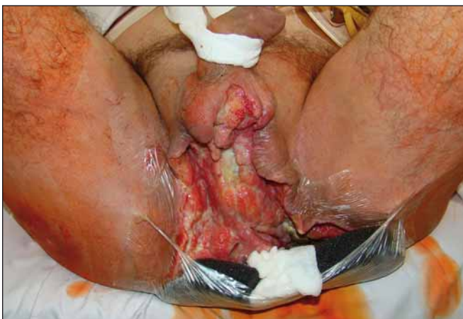
Obr. 5. Oblast hráze. Fig. 5. Perineal area.