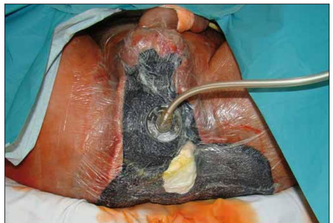
Obr. 6. Aktivní odsávání. Fig. 6. Active suction.

Nebyli jsme však úspěšní. Bylo nám doporučeno pokračovat v lokální péči o defekt. Souběžně byla řešena i nutriční podpora a rehabilitační péče.