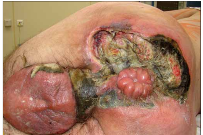
Obr. 2. Druhá nekrektomie. Fig. 2. Second necrectomy.