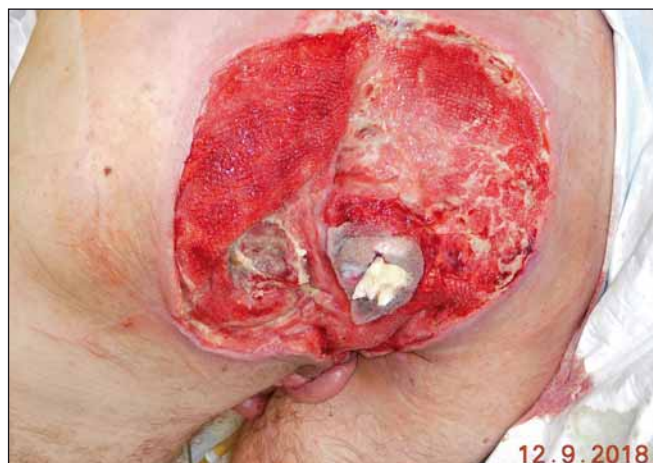
Obr. 8. Stav po odstranění podtlakového systému.

Fig. 7. Status before removal of negative pressure wound therapy.