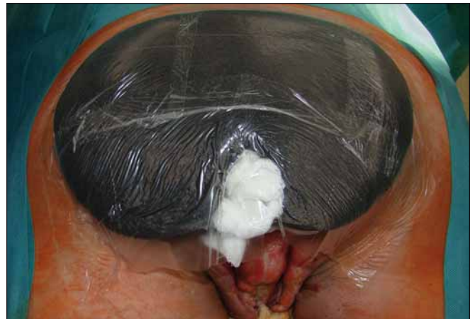
Obr. 4. Sakrální oblast. Fig. 4. Sacral area.