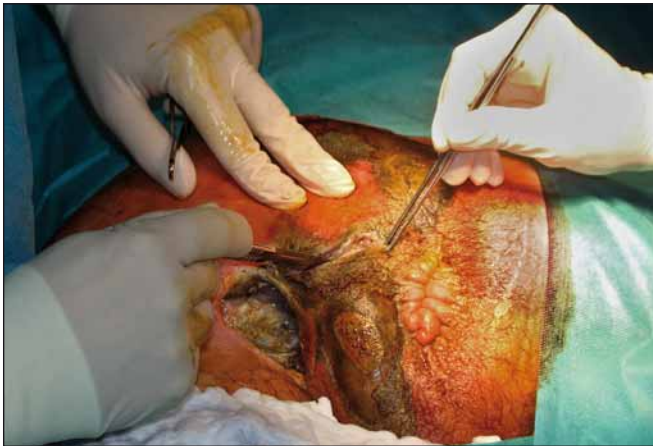
Obr. 1. První nekrektomie. Fig. 1. First necrectomy.