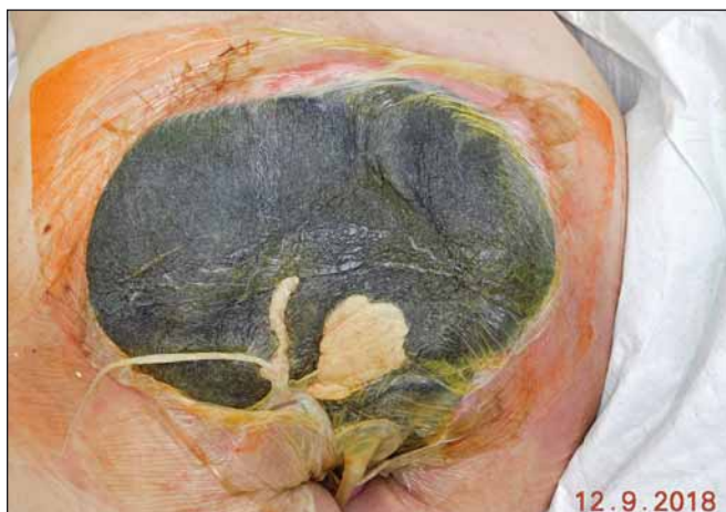
Obr. 7. Stav před odstraněním podtlakové terapie.

Fig. 7. Status before removal of negative pressure wound therapy.