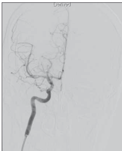
Obr. 1. Stav po mechanickej trombektómii na DSA v koronárnom reze projekcia podľa Towna.

Fig. 1. State after mechanical thrombectomy on DSA in coronary section, Towne projection.