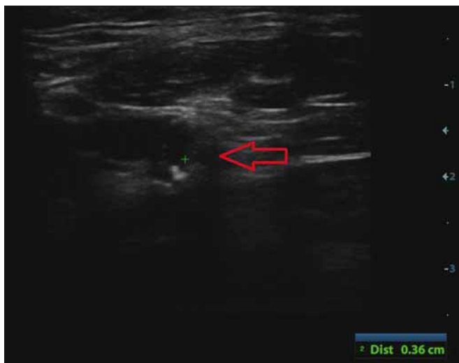
Obr. 1. Echolucentní (anechogenní) část aterosklerotického plátu > 8 mm 2 hodnocená jako krvácení do aterosklerotického plátu na duplexní sonografii.

Fig. 1. Echolucent part of atherosclerotic plaque > 8 mm 2 on duplex ultrasound evaluated as intraplaque hemorrhage.