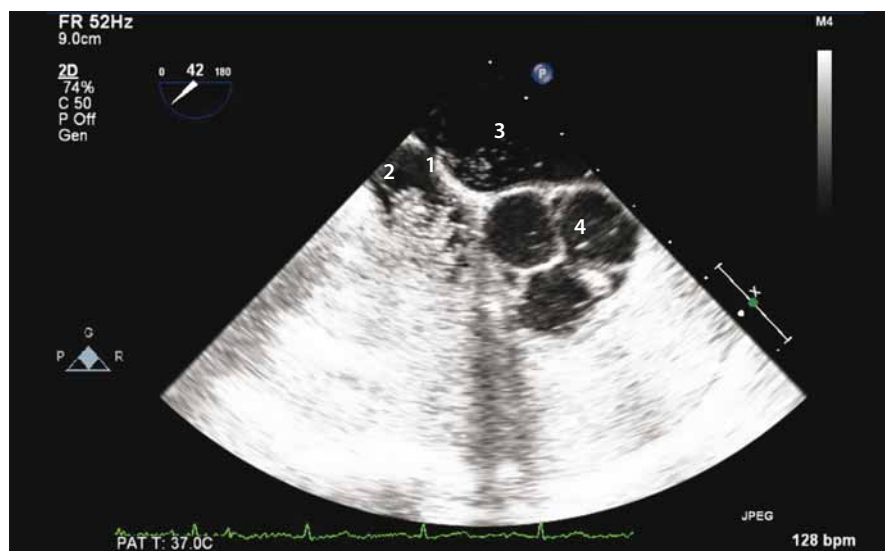
Obr. 1. Sonografický průkaz zkratu pomocí pozitivního echoktrastu – 1. septum síní; 2. pravá síň z větší část vyplněná echo kontrastem; 3. levá síň; 4. aortální chlopeč trojčípá.

Fig. 1. Sonographically proved shunt by contrast echocardiography – 1. interatrial septum; 2. right atrium mostly filled with echo contrast; 3. left atrium; 4. tricuspid aortic valve.