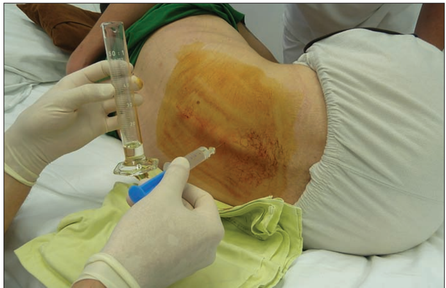
Obr. 1. Baklofénový test – jednorázové intratekálne podanie baklofénu lumbálnou punkciou.

V období od 9/2004 do 2/2019 sme na Neurochirurgickej klinike implantovali baklofénovú pumpu – SynchroMed II (Medtronic, Dublin, Írsko) v liečbe ťažkej refraktérnej spasticity 24 pacientom. Súbor tvorilo 8 žien, 16 mužov, s mediánom veku 36 (30–51) rokov, najmladší pacient bol 16 ročný, najstarší 65 ročný. Celkom 13 pacientov utrpelo úraz miechy (od C3 po Th9), 7 pacientov má roztrúsenú sklerózu v chronicko-progredujúcom štádiu, s mediánom anamnézy ochorenia 12 (9–19) rokov pred implantáciou baklofénovej pumpy. Ďalší 4 pacienti trpia spasticitou inej cerebrospinálnej etiológie: 1x DMO, 1x neurogénna dystónia, 1x bazilárna meningitída v detstve, 1x hereditárna spastická paraparéza. Pacienti trpeli ťažkou, prevažne spinálnou spasticitou. Boli vyčerpané možnosti farmakoterapie, tzn. ďalšie zvyšovanie dávky nevedlo k zníženiu svalového hypertonusu či k zmierneniu bolestivých spazmov. V troch prípadoch bol limitom farmakoterapie výskyt nežiadúcich účinkov zo strany gastrointestinálneho traktu (GIT) pri navyšovaní dávky. Pacienti boli väčšinou imobilní, používali invalidný vozík, len traja pacienti boli schopní chôdze pomocou chodítka, event. pomocou francúzskych barlí.