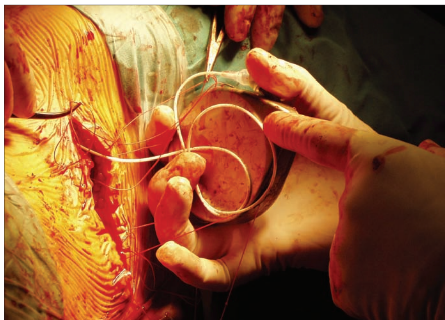
Obr. 3. Implantácia baklofénovej pumpy – napojenie tunelizovaného katétra na pumpu, ktorá je následne vložená do podkožia.

Fig. 2. Baclofen pump implantation – catheter is inserted into the intrathecal space.