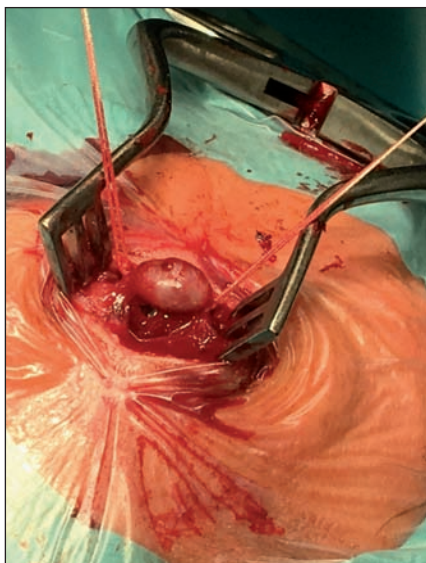
Obr. 2. Peroperační fotografie, stav po vypreparování vaku a ligaci přívodné a odvodné tepny.

Fig. 2. Operative image, the state after preparation of the aneurysm and ligation of the inlet and outlet arteries.