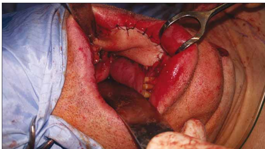
Obr. 4. Lalok fixován do defektu (pacient č. 1).

Fig. 3. Elevation of the flap (patient No. 1).