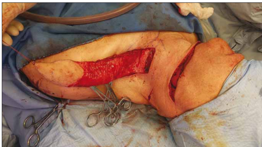
Obr. 3. Elevace laloku (pacient č. 1).

Fig. 3. Elevation of the flap (patient No. 1).