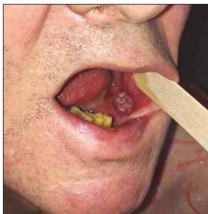
Obr. 1. Velikost a lokalizace tumoru před operací (pacient č. 1).

TNM – klasifikace zhoubných novotvarů (T – tumor, N – nodus, M – metastáza)