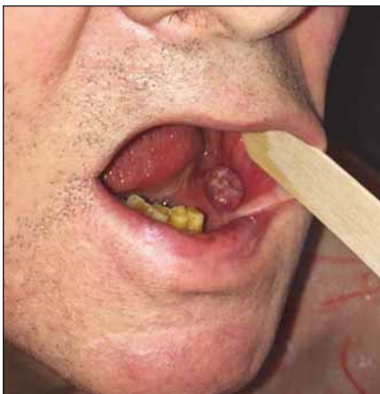
Obr. 1. Velikost a lokalizace tumoru před operací (pacient č. 1).

TNM – klasifikace zhoubných novotvarů (T – tumor, N – nodus, M – metastáza)