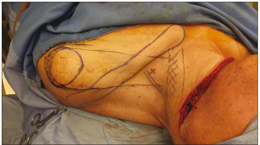
Obr. 2. Peroperační nářez laloku (pacient č. 1).

Fig. 1. Size and location of the tumor before surgery (patient No. 1).