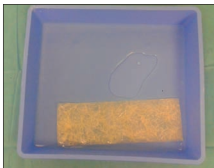
Obr. 1. Duralní graft připravený k aplikaci po 2min naložení do fyziologického roztoku.

Fig. 1. The dural graft is ready to use after 2 min in rehydration fluid.