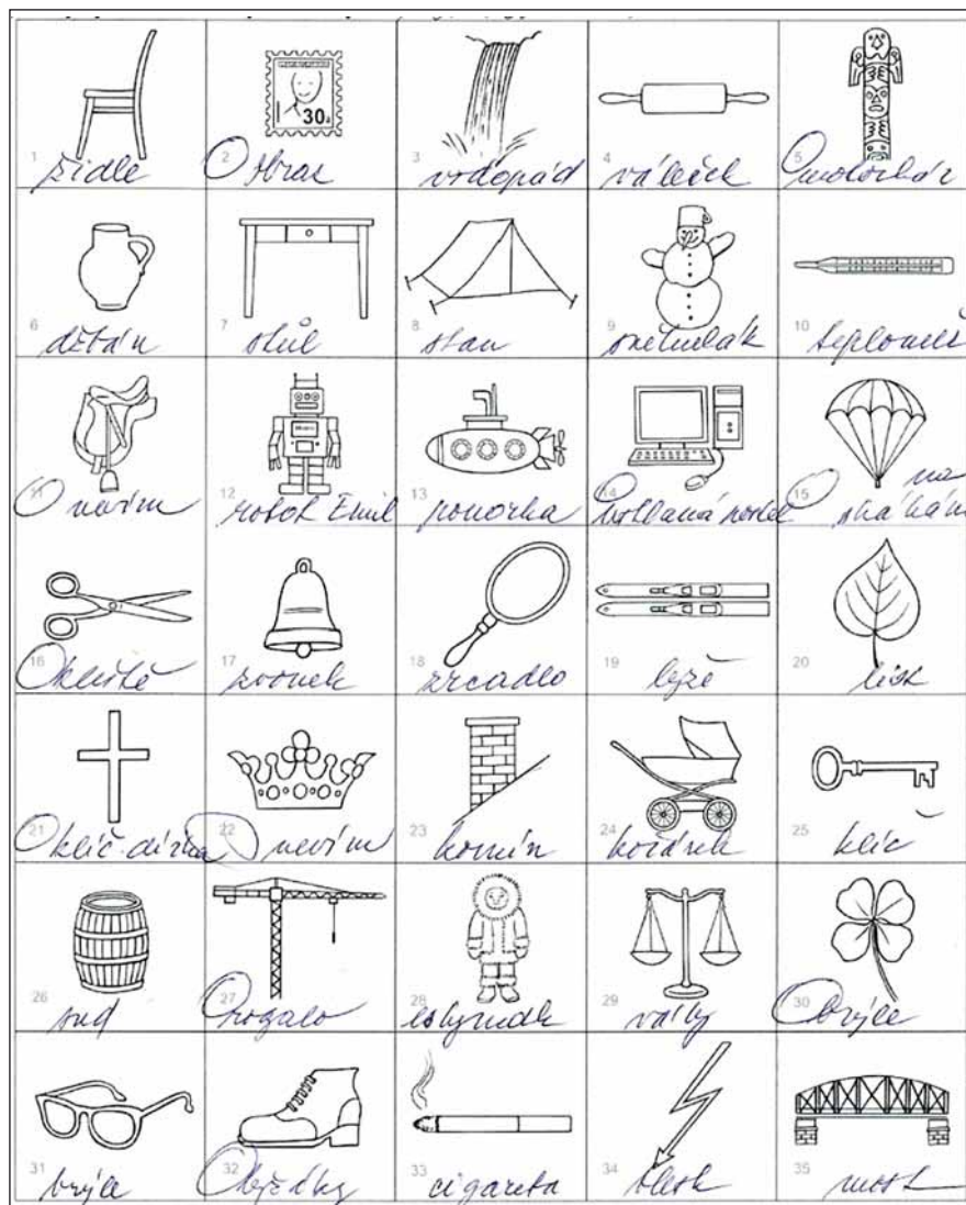
Obr. 3. Autentický arch s 35 obrázky vyplněný pacientem se skórem Mini-Mental State Examination 29 bodů. Povšimněte si dvojího typu chyb – chyby v pojmenování (tzv. sémantické paragafie) a vůbec nepojmenované (tzv. anomie).

Seznam všech postupně vyřazených obrázků předkládáme v tab. 2. Důvody jsme vyjmenovali v metodice. Hlavním výstupem naší činnosti jsou tab. 3, 4 a 5, které obsahují názvy obrázků pojmenovatelné správně v 90 % a více staršími osobami. Podle rozdílu úspěšnosti pojmenování mezi zdravými staršími osobami a pacienty s kognitivními poruchami jsou obrázky rozděleny do tří tabulek: 1. obtížné s rozdílem > 20 % v tab. 3;