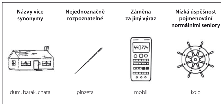
Obr. 1. Příklady vyřazených obrázků a systémové důvody k jejich odstranění při hledání vhodných obrázků.

Fig. 1. Examples of eliminated pictures and reasons to remove them when searching for appropriate pictures.