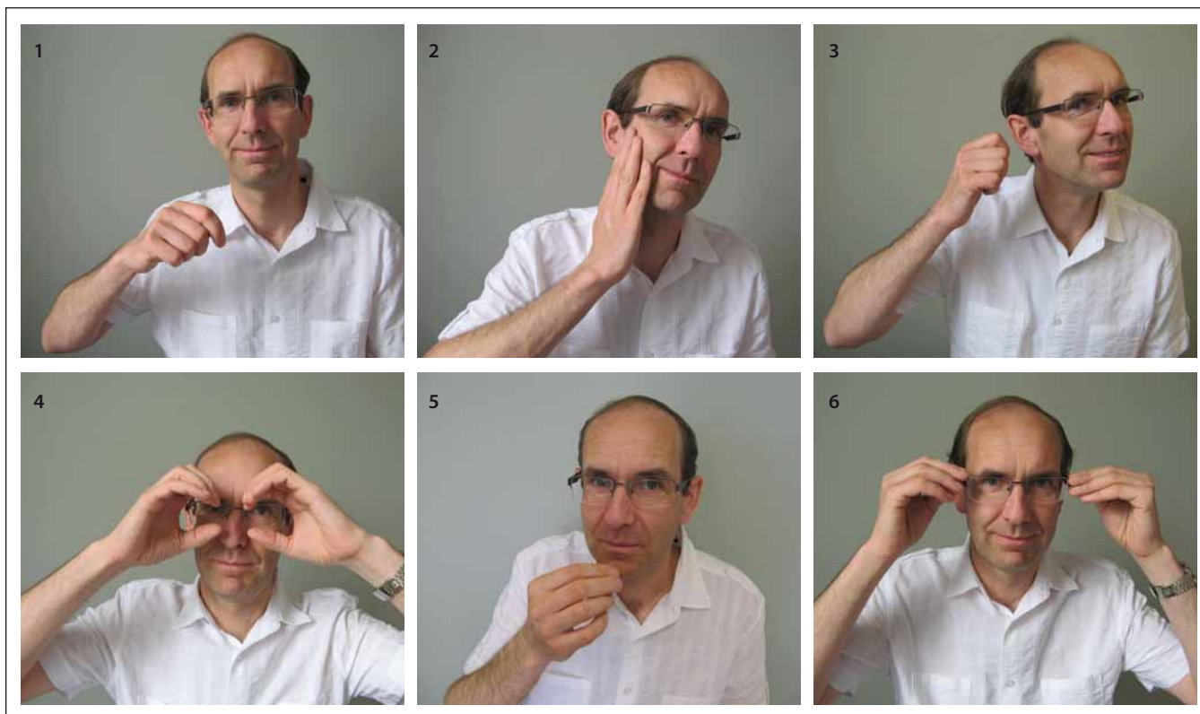
Obr. 1. Šest gest symbolizujících lidské smysly k testování epizodické paměti testem TEGEST jsou v pořadí, jako by byly uspořádány do kruhu od úst (1. chuť – jíte lžící) přes tvář (2. hmat – hladíte se po tváři), ucho (3. sluch – telefonujete), oči (4. zrak – díváte se dalekohledem) k nosu (5. čich – přičichnete ke květině). Nakonec se přidává jedno gesto týkající se znovu zraku (6. nasadíte si brýle).

Nový test se podle hlavního obsahu nazývá Test gest se zkratkou TEGEST vzniklou spojením obou slov názvu. Úkolem vyšetřované osoby bylo předvést šest pokynů, které se týkaly pohybu ruky hlavy, jakousi panto-