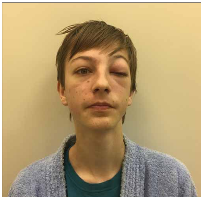
Obr. 1A) Otok a zarudnutí horního víčka vlevo, stav před operací. Fig. 1A) Swelling and redness of the left upper eyelid, preoperative condition.