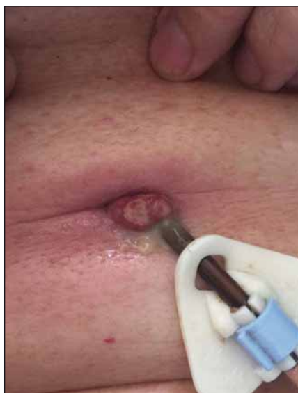
Obr. 1. Granulomatózní komplikace v místě PEG jejunální sondy.

Fig. 1. Hypergranulomatosis complication in place of jejunal PEG insertion.