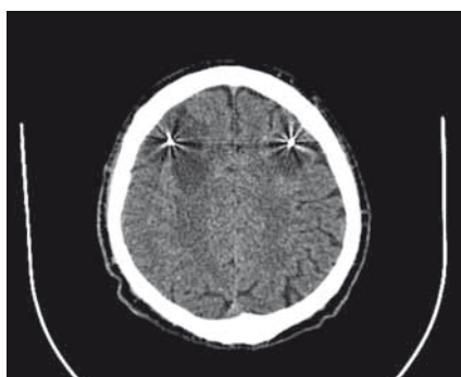
Obr. 2. CT vyšetrenie 10. deň po operácii s ložiskom vpravo; objavilo sa podobné ložisko ischemického charakteru okolo elektródy vľavo.

Fig. 1. CT scan 3 days after operation with hypodense lesion around electrode on the right side.