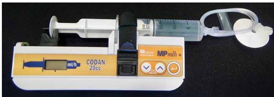
Obr. 4. Subkutánne podávanie apomorfínu pomocou pumpy (upravené podľa propagačného materiálu Micrel Medical Devices). Pumpa čerpajúca liečbu z pripojenej striekačky ukončená katétrom s tenkou ihlou.

Väčšina štúdií preukázala jeho efektivitu v redukcii „off“ stavov ako i prejavov viazaných na „off“ periód, ako napr. ranná dystónia, dysfágia a bolestivé „off“ stavy [150–152].