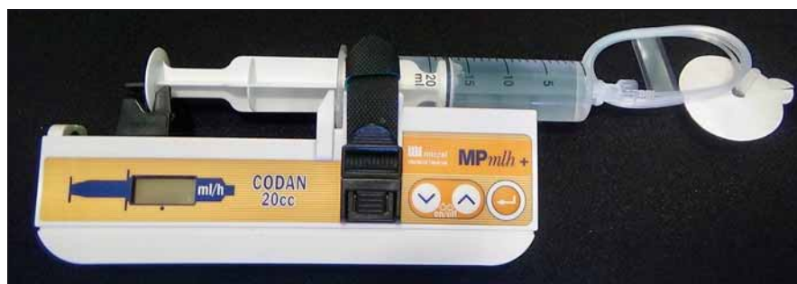
Obr. 4. Subkutánne podávanie apomorfínu pomocou pumpy (upravené podľa propagačného materiálu Micrel Medical Devices). Pumpa čerpajúca liečbu z pripojenej striekačky ukončená katétrom s tenkou ihlou.

Väčšina štúdií preukázala jeho efektivitu v redukcii „off“ stavov ako i prejavov viazaných na „off“ periód, ako napr. ranná dystónia, dysfágia a bolestivé „off“ stavy [150–152].