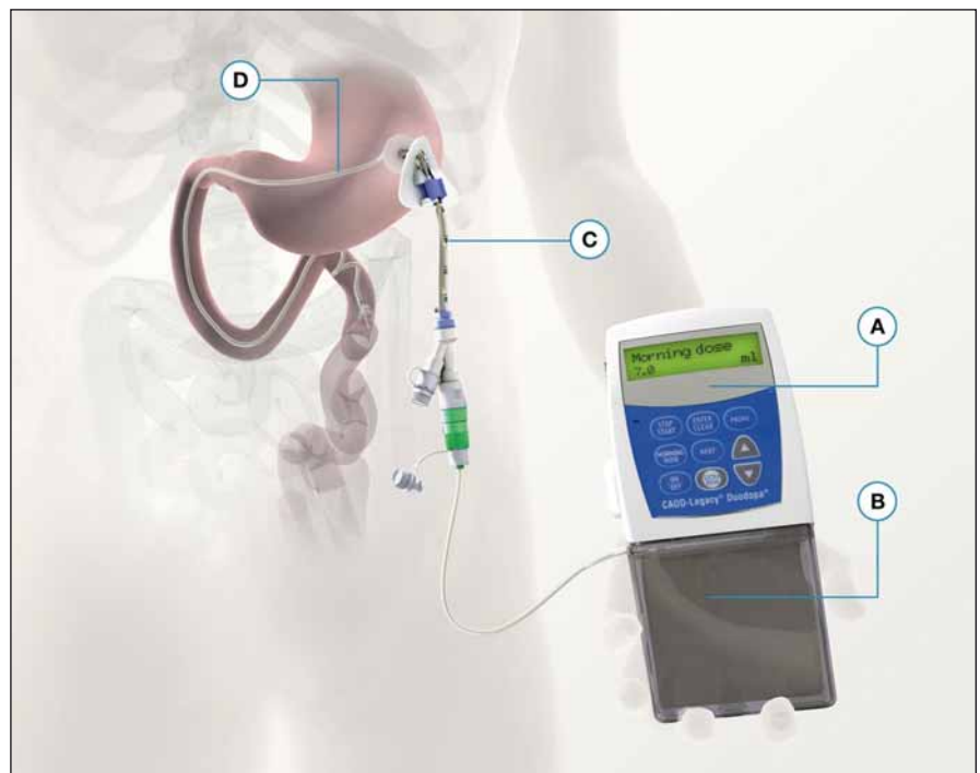
Obr. 3. Schéma intestinálneho podávania L-Dopa/carbidopa gélu (upravené podľa propagačných materiálov Abbvie).

Benefit konvenčnej DBS s kontinuálnou stimuláciou môže byť prekrytý nežiaducimi účinkami a nastavenie parametrov nezaručuje dlhodobé udržanie efektu; nerešpektuje progresiu ochorenia či efekt súbežne užívannej liečby. To môže mať negatívny vplyv na efektivitu liečby a vyžadovať opakovanú úpravu stimulačných parametrov [103]. V súčasnosti sa presadzuje teória o DBS „ušitej na mieru“ podľa individuálnych potrieb pacienta umožňujúca zmenu stimulačných parametrov podľa objektívnych parametrov [104]. Tento typ stimulácie sa nazýva adaptívna DBS (aDBS). Ide o vysokofrekvenčnú stimuláciu s pravidelnými interpulzátívnymi intervalmi, ktorá i napriek celkovo kratšej dobe stimulácie v porovnaní s konvenčnou DBS preukázala lepšiu efektivitu [105,106]. Systém aDBS má za cieľ „uzavretie okruhov“ na základe interpretácie