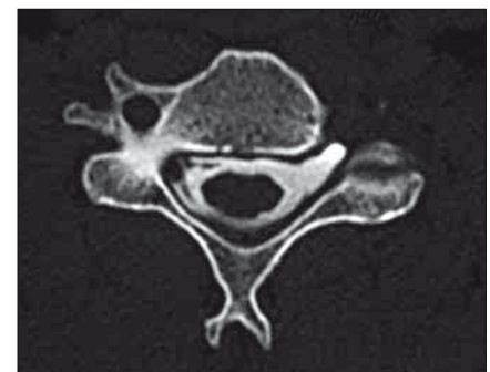
Obr. 3. Příklad prokázané avulze kořene C5 vlevo dle CT myelografie (likvorová pseudocysta a chybějící ventrální i dorzální kořen vlevo).

z oblasti kořenů C8–Th1. Registrační elektrody se umístí na oblast plexus brachialis (Erbův bod) a spinálně nad oblast krční intumescence (trn obratle C5). V oblasti Er-