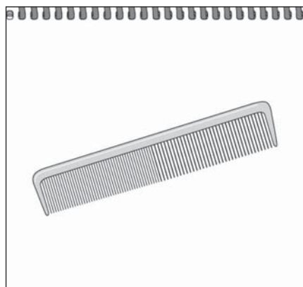
Obr. 1. Příklad podnětu v BNT-60.

Test obsahuje ve standardní, nezkrácené verzi 60 černobílých kreseb běžných objektů (BNT-60) (obr. 1). Původní experimentální verze testu BNT z roku 1978 [4] obsahovala 85 obrázků, roku 1983 byla revidována do dnešní standardní podoby se 60 položkami [2]. Druhá revize testu z roku 2000 obsahovala kromě standardního 60položkového testu i 15položkovou zkrácenou verzi (BNT-15) [5]. Slova (podstatná jména jako pojmenování obrázků) BNT-60 jsou uspořádána od nejjednodušších po nejobtížnější, která jsou v jazyce nejběžnější a nejvíce frekventovaná (např. dům, květina, postel), až po méně běžná (iglu atd.). Testovaný má jednoslovně, nebo pokud je to jazykově patřičné souslovím (např. mořský koník), pojmenovat vizuálně prezentované podnětové karty tzv. konfrontační po-