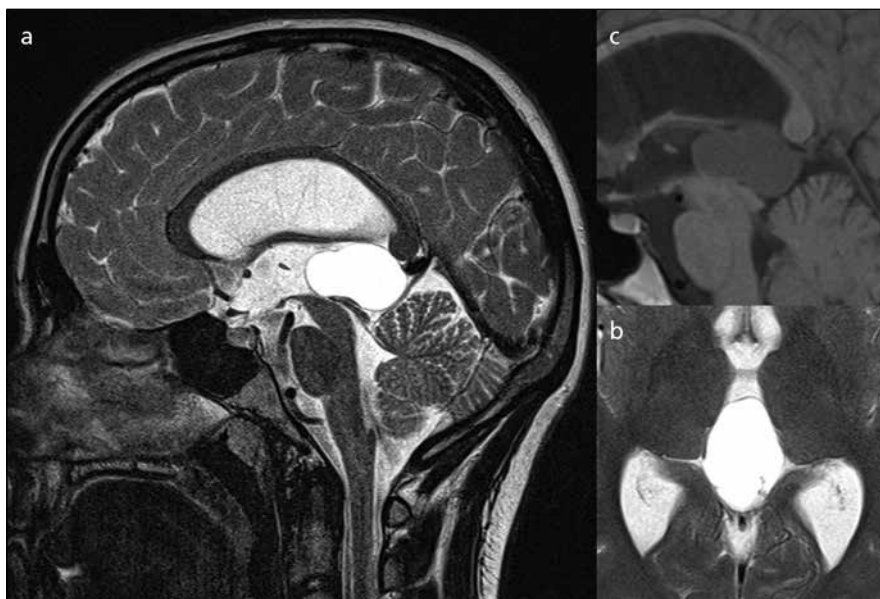
Obr. 1. Typické vzezření velké pineální cysty na magnetické rezonanci.

Následně byl vypracován přehled mezinárodní literatury za roky 1983–2013, na nejdůležitější práce jsou v textu reference. Ve vybraných případech jsou uvedeny odkazy i na starší práce.