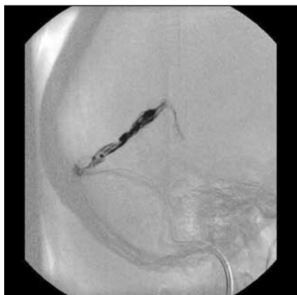
Obr. 2. Mozková angiografie se zavedeným mikrokátérem do sinus rectus a pracovním kátérem do jugulárního bulbu.

Trombóza sinus rectus a venózní městnání v obou thalamech.