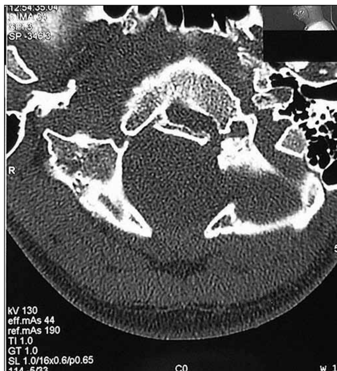
Obr. 3. CT obraz po zhojení zlomeniny kondylu okcipitu.