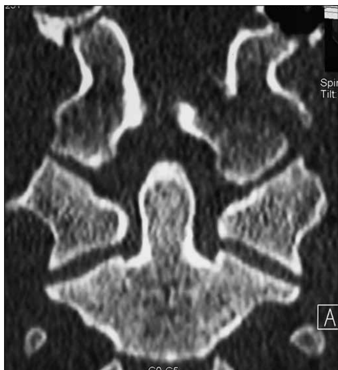
Obr. 1. CT obraz koronární rekonstrukce avulzní zlomeniny typu III podle Anderson a Montesano, typ IIA podle Tuliho.