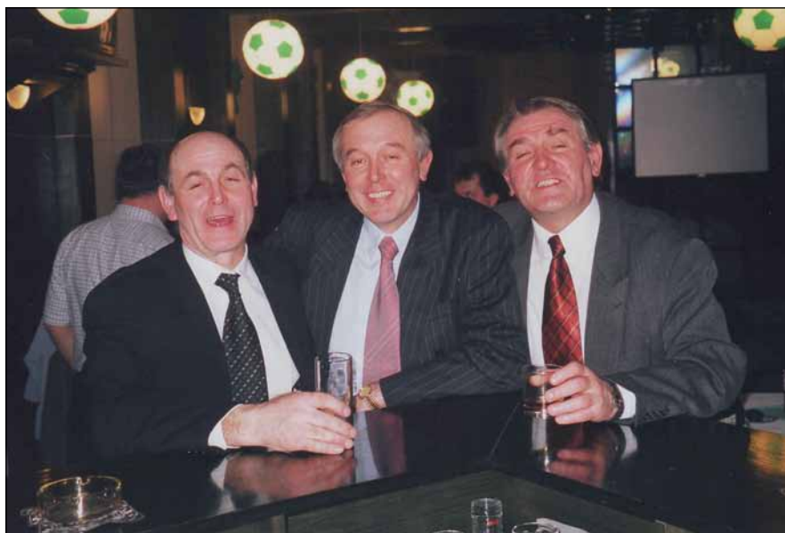
Obr. 1. Typický symptom AD OPMD v rodině (ptóza).

Autoři prohlašují, že studie na lidských subjektech popsána v manuskriptu byla