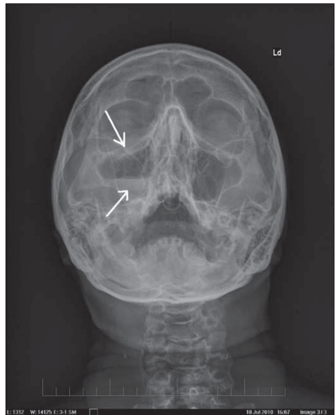
Obr. 3. RTG lebky: 47-ročný pacient po úraze páčidlom do tváre pod pravé oko – spodná projekcia.

Fraktúra spodiny očnice a hladina voľnej tekutiny v pravej maxilárnej dutine.