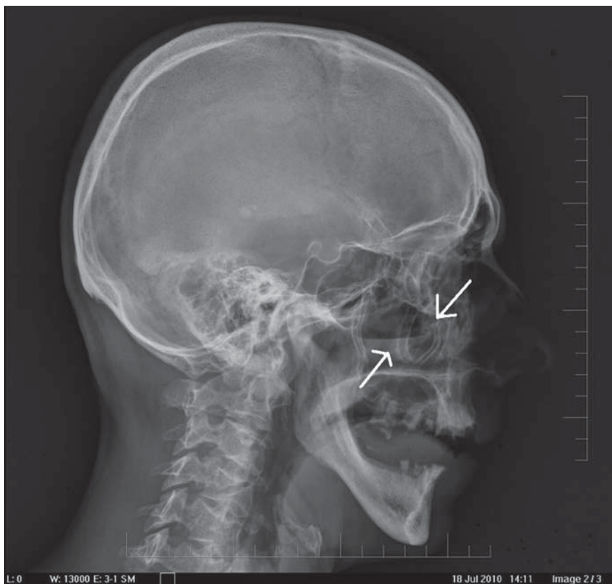
Obr. 4. RTG lebky: 47-ročný pacient po úraze páčidlom do tváre pod pravé oko – pravá projekcia.