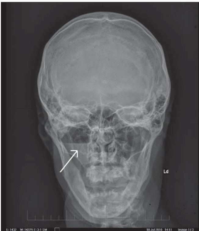
Obr. 2. RTG lebky: 47-ročný pacient po úraze páčidlom do tváre pod pravé oko – predná projekcia.

Fraktúra spodiny očnice a hladina voľnej tekutiny v pravej maxilárnej dutine.