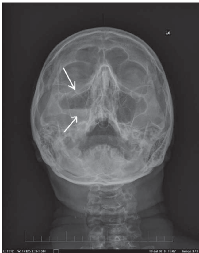
Obr. 3. RTG lebky: 47-ročný pacient po úraze páčidlom do tváre pod pravé oko – spodná projekcia.

Fraktúra spodiny očnice a hladina voľnej tekutiny v pravej maxilárnej dutine.