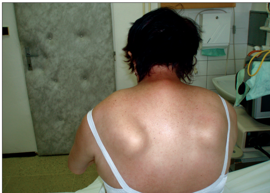
Obr. 1. Porucha fixace lopatek a slabost šíjového svalstva.

Vzhledem ke klinickému nálezu se zvýšenými svalovými enzymy v séru a EMG nálezu jsme v této fázi indikovali svalovou biopsii. Biopsií m. vastus lateralis vpravo byla prokázána poměrně pokročilá svalová atrofie s kombinací neurogenních prvků (angulární atrofická vlákna, fenomén „type grouping“) i prvků myopatického vzorce (kulatá atrofická vlákna, internalizace jader, fenomén štěpení vláken). Zastižen byl ložiskový endomysialní i perimysialní lymfocytární infiltrát sestávající převážně z CD8+ T lymfocytů. Dále byla pozorována přítomnost tzv. lemovaných vakuol s bazofilním jemně granulárním obsahem (obr. 2). Elektronmikroskopicky byly v oblastech lemovaných vakuol pozorovány membranózní víry, navíc byly