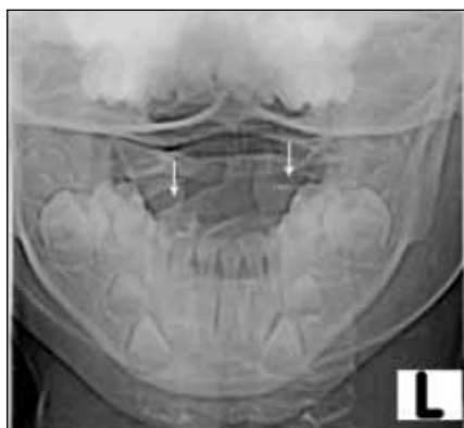
Obr. 1. Kazuistika 1: rtg transorální snímek krční páteře. Asymetrické postavení C1/C2 (šipky).

Jedenáctiletý chlapec prodělal na ORL klinice totální tyreoidektomii pro nodózní strumu. Vlastní operační výkon nebyl provázen vznikem peroperačních komplikací. Po operaci bezprostředně vznikla dušnost s laryngeálním kašlem vyžadující podání kortikoidů parenterálně. Pro přetrvávající laryngální kašel se stridorem byl následující den nasazen Augmentin parenterálně. Stav byl ve shodě s provedeným pediatrickým vyšetřením uzavřen jako akutní laryngotracheitida. Od třetího pooperačního dne došlo k postupnému rozvoji pravostanné tortikolis, která byla provázena subfebriliemi. Celý krk byl měkký a volně prohmatný, bez zjevného zarudnutí kůže. Laboratorní vyšetření potvrdila elevaci závažných markerů (leukocytóza, hodnota CRP 224), proto bylo pokračováno v pa-