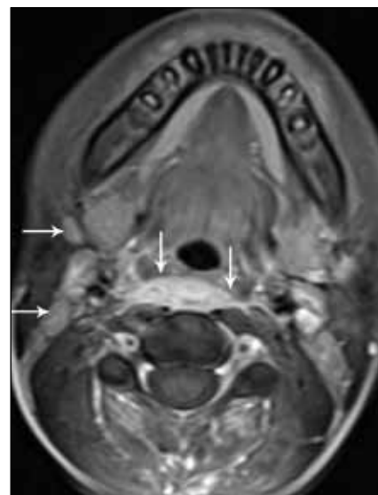
Obr. 3. Kazuistika 2: MR krku, axiální rovina, T1 po aplikaci kontrastní látky. Zánětlivý infiltrát retrofaryngeálně v úrovni C3 (svislé šipky), oboustranně reaktivně zvětšené lymfatické uzliny (vodorovné šipky).

Léčba Griselova syndromu závisí na stupni subluxace C1 a C2 a trvání pří-