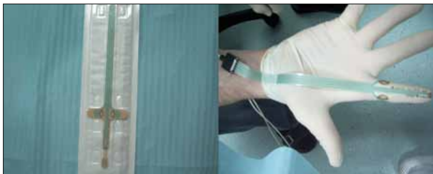
Obr. 3. Pudendální elektroda.

vního análního sfinkteru je méně než 2 [7]. SF EMG elektrodou se dá též měřit instabilita MUP – tzv. jitter, toto měření se však u svalů pánevního dna rutinně neužívá. Svalová hustota bývá vyšší u reinervovaných svalů, SF EMG tak může vzhledem ke své vysoké senzitivitě odhalit poměrně diskrétní reinervační změny, k detekci spontánní aktivity však příliš vhodná není.