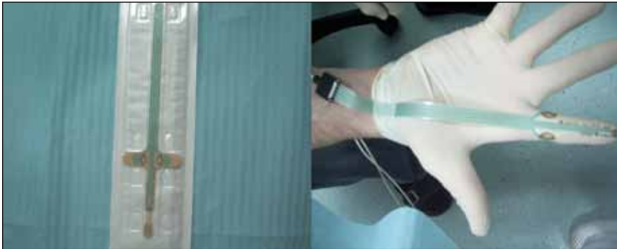
Obr. 3. Pudendální elektroda.

vního análního sfinkteru je méně než 2 [7]. SF EMG elektrodou se dá též měřit instabilita MUP – tzv. jitter, toto měření se však u svalů pánevního dna rutinně neužívá. Svalová hustota bývá vyšší u reinervovaných svalů, SF EMG tak může vzhledem ke své vysoké senzitivitě odhalit poměrně diskrétní reinervační změny, k detekci spontánní aktivity však příliš vhodná není.