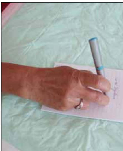
Obr. 5. Písařská křeč u 48leté učitelky mateřské školy. Křečovitě (dystonické) sevření tužky se objevuje pouze při psaní, takže je psaní zcela blokováno.