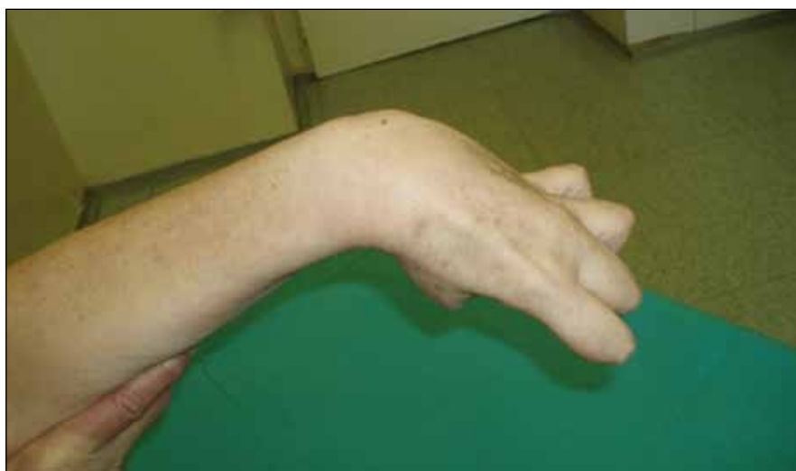
Obr. 10. Dvašedesátiletá žena rok po ischemické CMP s levostrannou hemiparézou – flekční spasticita ruky s ulnární dukcí, addukcí a flexí palce, flexí prstů.