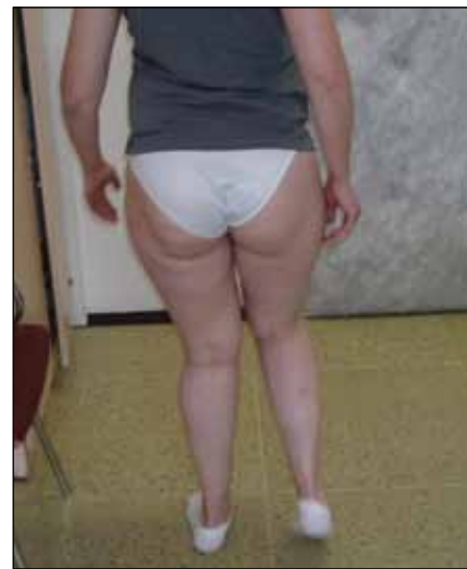
Obr. 13. Čtyřiatřicetiletá žena s DMO. Flekční a addukční spasticita stehen, extenzní bérců.

Blefarospasmus se provokuje prudkým nebo intenzivním světlem, námahou očí, akcentuje se ve stresové situaci. Tito nemocní pak mají problémy se čtením, psaním, sledováním televize, řízením, často pak nejsou schopni přejít silnici – v této stresové situaci se provokuje trvalá kontrakce orbikulárních svalů. Spazmy se sevřením víček mohou být zmírněny či blokovány mluvením, zíváním, zpíváním anebo jinými „senzorickými triky“. Závažnost blefarospasmu se může hodnotit podle různých škál. Jankovičova škála hodnotí mrkání, třepotání víček a spazmy víček. Přitom vždy vyjadřuje tíži a frekvence jednotlivých příznaků [3]. BSDI (The Blepharospasm Disability Index) posuzuje postižení specifických každodenních aktivit – čtení, sledování televize, nakupování, chůze, denní aktivity a řízení. Každé položení přisuzuje 0–4 body. Nemocní s blefarospasmem mají sníženou kvalitu ži-