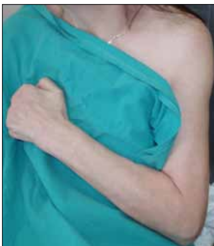
Obr. 8. Třiašedesátiletá žena s těžší spastickou levostrannou hemiparézou – flekční spasticita předloktí a prstů.