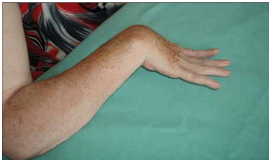
Obr. 9. Osmapadesátiletá žena šest měsíců po CMP s pravostrannou hemiparézou – spasticita ruky s flexí v zápěstí, extenzí prstů a ulnární dukcí ruky.

2/3 nemocných s cervikální dystonií udávají bolesti v šíji.