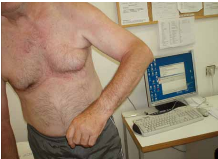
Obr. 7. Asociovaná reakce – zvyšující se abdukce levé paže při stojí a chůzi u 66letého muže jeden rok po ischemické CMP v řečišti a. cerebri media vpravo se středně výraznou levostrannou hemiparézou.

(či jinou aktivací) svalu. U hlouběji uložených svalů (např. m. flexor pollicis longus či m. flexor digitorum profundus) se využívá stimulace svalu (anebo jeho části) dutou EMG elektrodou a přitom se pozorují záškuby šlachy svalu i motorický efekt svalu – pohyb v segmentu končetiny (např. flexe distálního článku palce u m. flexor pollicis longus). Pro přesné zaměření bříska svalu se při hledání polohy