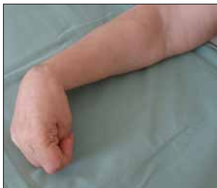
Obr. 12. Flekčně-pronační spasticita v lokti, flekční v zápěstí, flekční prstů s addukcí a flexí palce. Osmapadesátiletá žena po ischemické CMP v levé hemisféře.

Zcela nové období v léčbě cervikální dystonie začalo zařazením botulotoxinu do léčebného schématu. Botulotoxin je indikován jako lék první volby u cervikální dystonie, která je klinicky závažná – dle TWSTRS dosáhne tíže 10 a více bodů. U cervikální dystonie jsou nejčastěji postiženy mm. splenius capitis, splenius cervicis, levator scapulae, trapezius, scaleni, semispinalis capitis a sternocleidomastoideus. Před aplikací botulotoxinu do dystonických svalů je důležité provést klinický rozbor s určením svalů, do kterých se bude lék aplikovat, v jaké dávce a do kolika bodů v dystonickém svalu. K určení úrovně a distribuce dystonické ak-