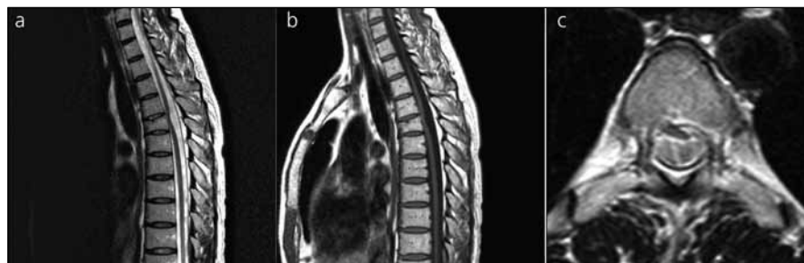
Obr. 2a, b) T2 a T1 vážený obraz, sagitální řez. Posttraumatická herniace míchy v úrovni Th 5. Stav po kompresivní fraktuře obratlového těla Th 5, tělo je ventrálně klínovitě deformované. Ventrální posun, deviace a zúžení míchy v úrovni Th5, rozšíření dorzálního subarachnoidálního prostoru.

Autoři Francis et al referovali o nemocném s posttraumatickou herniací míchy a o dalších 10 případech z literatury [5]. Mimo tento soubor uvádějí dalšího pacienta Spissu et al [6]. Publikovaná série odhalila, že jsou velké rozdíly v intervalu mezi traumatem a rozvojem klinických příznaků nezávisle na mechanismu úrazu. U některých pacientů nebyla příčinná souvislost trauma a herniace dostatečně doložena, spíše se tedy jednalo o herniace idiopatické (pět případů) [5]. Za etiologicky úrazové byly považovány případy, kdy bylo jasné trauma páteře v anamnéze a radiologický průkaz poranění obratlů