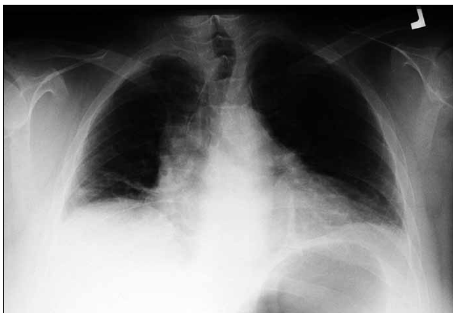
Obr. 1. Nemocná 1 – rtg snímek plic PA.

U 47letého muže pouze s nevýraznými vertebrogenními potížemi v anamnéze se v srpnu 2008 objevily bolesti v rame-