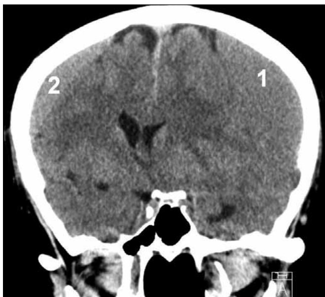
Obr. 1. CT nález oboustranného izodenzního CSDH – vlevo (1) šíře 23 mm, vpravo (2) šíře 12 mm, přetlak střední čáry o 14 mm doprava.

Operace byla u naprosté většiny pacientů provedena v analgosedaci, zatímco celková anestezie byla po domluvě s anes-