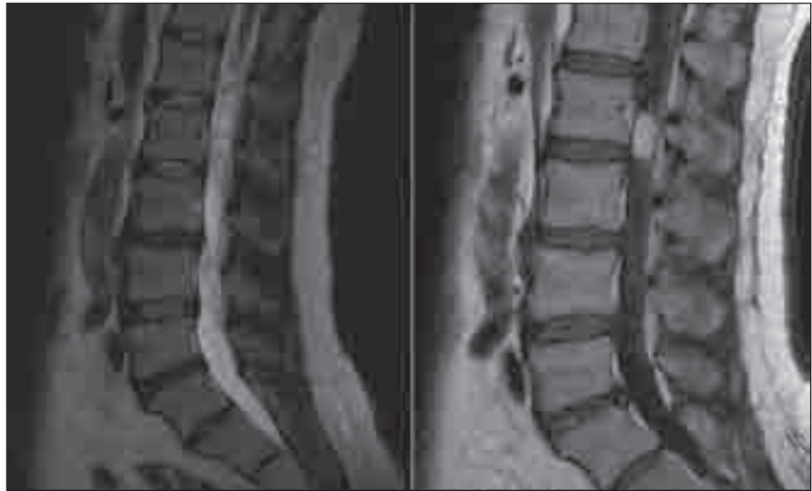
Obr. 1. MR T2WT a T1WT s kontrastem, sagitální rovina.

Přesné údaje o incidenci hemangioblastomů chybí, a to jak u tumorů ve sporadické formě, tak ve spojitosti s VHL [1]. Hemangioblastomy, svým chováním benigní nádory, tvoří asi 1,6 až 2,1 % všech míšňích tumorů, z toho 21 až 28 % lokalizovaných intradurálně-extramedulárně