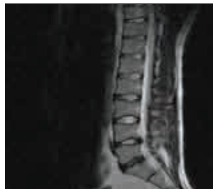
Obr. 3. MR vyšetření ze dne 18. 2. 2009.

Při dimisi byla Lasègueova zkouška vlevo od 50°, vpravo volně do 90°, nadále přetrvávala porucha dynamiky páteře, nebyla možná zejména extenze bederní páteře v segmentech L4/5 a L5/S1.