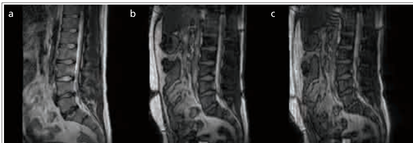
Obr. 4a–c. MR a dMR vyšetření z dne 2. 6. 2009.