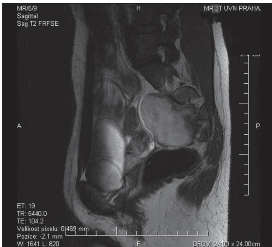
Obr. 4. MR obraz v T2 váženém obraze presakrálně vyrůstajícího ganglioneuromu ventrálně naléhajícího na konkávní plochu kosti křížové vlevo s mírnou propagací do foramen S2.