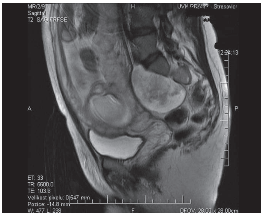
Obr. 1. Presakrálně vyrůstající neurofibrom v T2 váženém MR zobrazení.

Operační výkon byl veden v celkové anestezii. V poloze na zádech bylo nejprve původní jizvou po císařském řezu proniknuto a revidováno intraperitoneálně, poté do retroperitonea laterálně od mezosigmoidea. Tumor byl v hranici preparován, postupně mobilizována vasa iliaca vlevo a levý ureter. Následně byl tumor v celku resekován.