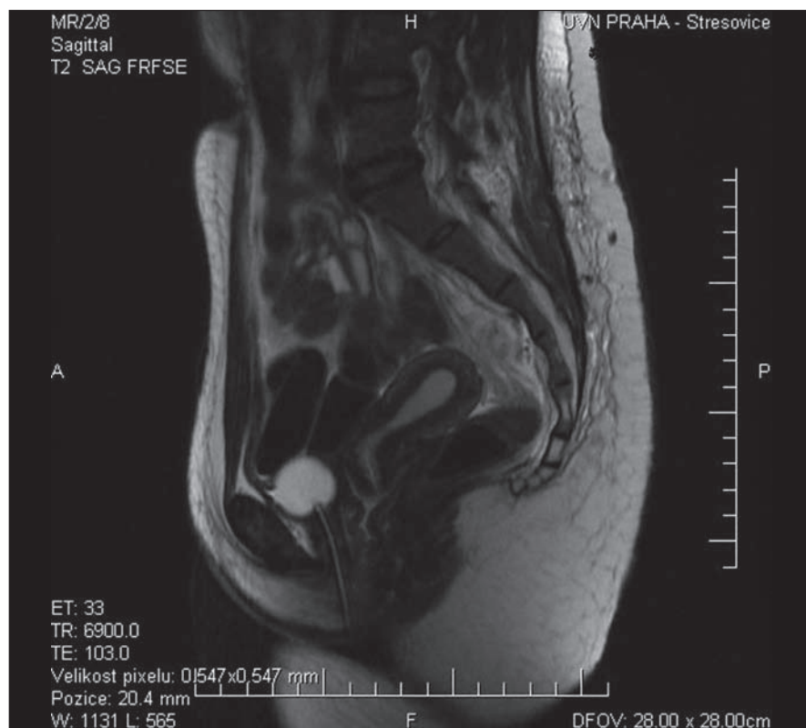
Obr. 5. Pooperační MR kontrola po resekci 90 % presakrálně rostoucího ganglioneuromu v T2 váženém obraze.