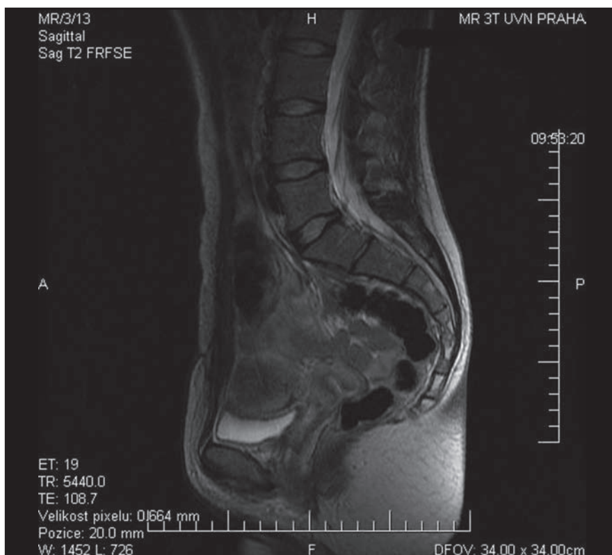
Obr. 3. MR kontrola v T2 váženém obraze – stav po resekci po neurofibromu bez známek recidivy či rezidua procesu.

Nemocná byla po vzájemné dohodě indikována k resekci nádoru. Od původního záměru resekovat nádor předním přístupem bylo upuštěno pro předpokládané těžké zajištění v oblasti malé pánve.