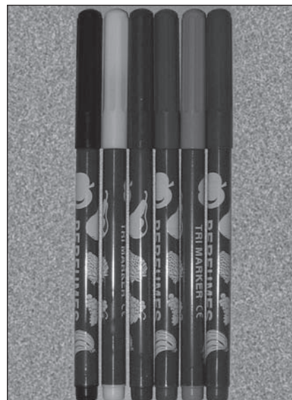
Obr. 1. Parfémované fixy používané k vyšetření čichu v OMT.

Pro možné použití OMT k časné diagnostice Parkinsonovy choroby jsme se rozhodli zaměřit se na pacienty s neurologickým onemocněním. Zajímalo nás, zda osoby s Parkinsonovou chorobou získají nižší bodové zisky než osoby zdravé a osoby s jiným neurologickým onemocněním. Do studie jsme se rozhodli zařadit také osoby s roztroušenou mozkomíšní sklerózou. U těchto nemocných sice porucha čichu není typickým symptomem, může však být přítomna v případě demyelinizace subtemporální a subfrontální oblasti [15]. Abychom dokázali odpovědět na otázku, zda se bodové zisky osob s Parkinsonovou chorobou budou lišit od výsledků nemocných s jinou etiologií poruchy čichu