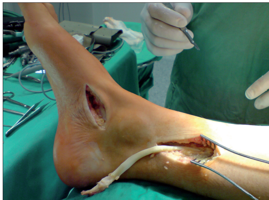
Obr. 1. Odběr šlachy m. tibialis posterior.

k transpozici byla v průměru 9,2 \pm 5,9 měsíce (1–34 měsíců). K terapii byla použita metoda, při níž se z incize distálně od mediálního kotníku vypreparuje šlachy m. tibialis posteriori a úponem na os naviculare, kde ji uvolňujeme. Druhou incizi provádíme na vnitřní straně bérce, na přechodu střední a dolní třetiny, kde si nacházíme průběh šlachy m. tibialis posteriori a vytahujeme jej do rány (obr. 1). Ze stejné incize si ozřejmíme interosseální membránu, kterou protínáme. Třetí incizi provedeme