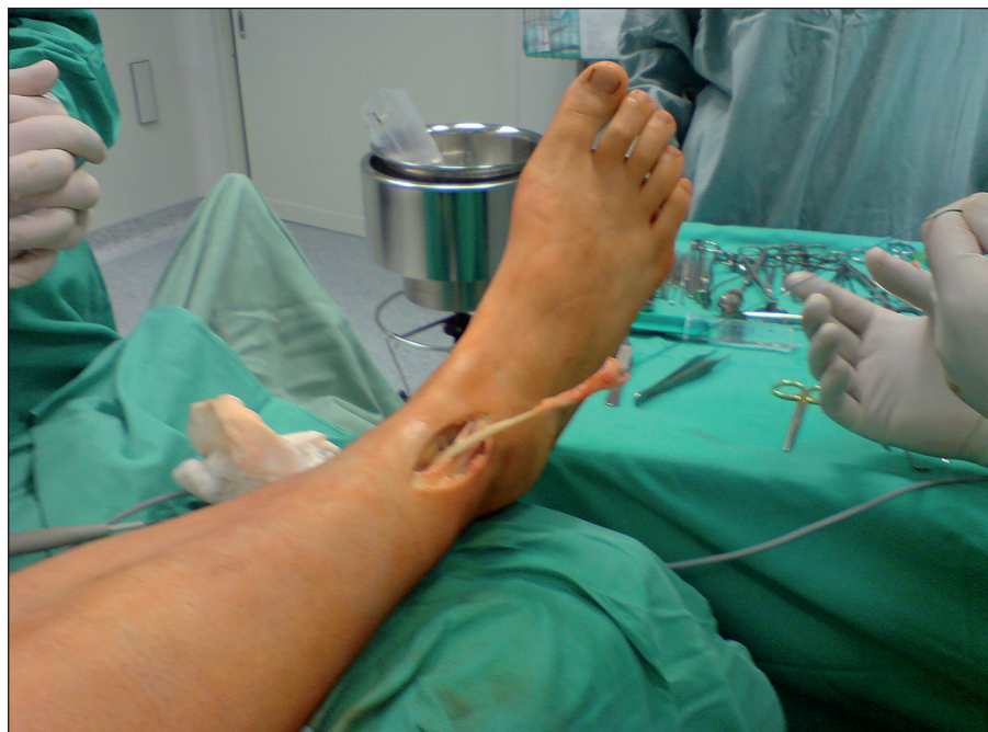
Obr. 2. Protáhnutí šlachy m. tibialis posterior interesosseální membránou ventrálně.

Perzistující peroneální paréza a s ní spojená deformita nohy má své ortopedické řešení. Efektivní operací je transfer šlachy m. tibialis posterior, který byl popsán již v roce 1933 Oberem [2]. Ten však transfer provedl cirkumtibiálně, tj. kolem tibie, čímž docházelo nejen ke ztrátě svalové délky, ale i svalové síly. V roce 1937 Mayer [3] prvně popsal transpozici m. tibialis posterior skrze interesosseální membránu za účelem korekce ekvinózního postavení nohy. Následovala sdělení celé řady autorů o této operaci jako metodě k navrácení aktivní dorziflexe hlezna u pacientů s neuromuskulárními chorobami či peroneální parézou. Watkins et al [4] v roce 1954 publi-