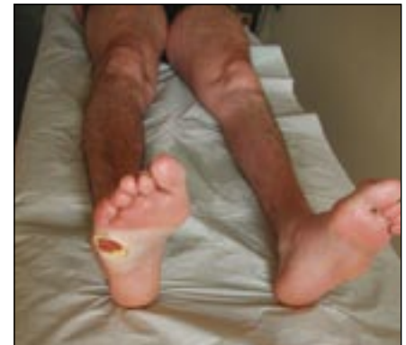
Obr. 6. HSN1 – ulcerace pod hlavičkou V. metatarzu.

Pravděpodobnost detekce kauzální mutace klesá pod 5 %, pokud se vyloučí mutace v PMP 22, GJB 1, PO a MFN-2 genech. Jestliže DNA analýza neprokáže kauzální mutaci zodpovědného genu, není diagnóza CMT choroby vyloučena.