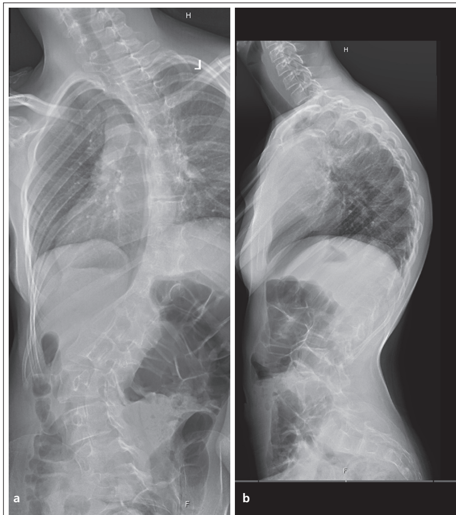
Obr. 1. Předoperační RTG snímky neuromuskulární skoliózy (a: zadopřední, b: boční).

Na Ortopedické klinice FN Brno jsme v letech 1992–2006 operačně ošetřili technikou Luque-Galveston 42 pacientů se základní diagnózou neuromuskulární deformity páteře a přidružené obliquity pánve.