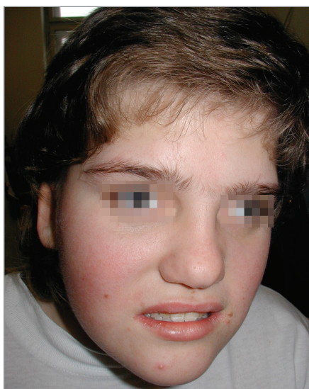
Obr. 1. Kraniofaciální dysmorfie. Brachycefalie, hypoplazie střední obličejové části, prominující brada.

Noční polysomnografie zjistila zkrácenou latenci usnutí (3 min), snížené za-