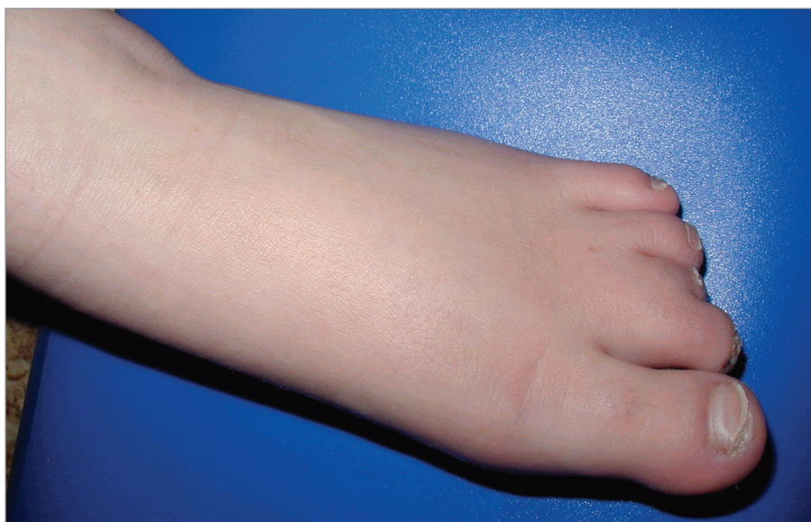
Obr. 2. Brachydaktylie na dolních končetinách. Dále je patrná syndaktylie 2. a 3. prstu, která je vedlejším nálezem a není pro tento syndrom typická.