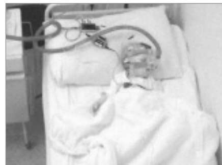
Obr. 2. Pacient č. 1 na terapii BiPAP během nočního spánku.

binace primidon, topiramát, fenytoin). V EEG byly patrné epileptiformní výboje nad pravým zadním kvadrantem s maximem temporálně. MRI mozku zobrazila postmaltickou pseudocystu komunikující s pravou postranní komorou. Ve 14 měsících se po opakovaných respiračních infektech objevilo během spánku výrazné chrápání, stridor, zástavy dechu s následným zatahováním, lapáním po dechu, kašlem a nauzeou. Během dne byl chlapec unavený, špatně polykal, přestal přibývat na hmotnosti. Před vyšetřením na našem pracovišti byla pro noční dechové potíže provedena řada vyšetření. Noční EEG videomonitorace nespovědila pro epileptický původ noční dyspnoe. ORL vyšetření nezjistilo významnou hypertrofii adenoidní vegetace ani tonzil, chirurgický výkon nebyl indikován, nález při laryngotracheobronchoskopii byl normální. Bylo provedeno kardiologické, alergologické a imunologické vyšetření (s nálezem hypogamaglobulinemie IgA). EMG vyšetření nespovědilo pro nervosvalové onemocnění. Jícnová pH-metrie prokázala gastroezofageální reflux (GER), který byl léčen omeprazolem a domperidonem bez efektu na noční potíže. Stejně tak byla bez efektu terapie inhalacími kortikoidy, perorálními bronchodilatancii a antihistaminiky. Po 4 měsících trvání potíží byla na našem pracovišti provedena noční polysomnografie (PSG) s nálezem těžké spánkové apnoe smíšeného typu, s převahou obstrukčních apnoí. Pravděpodobný byl podíl GER na vzniku noč-