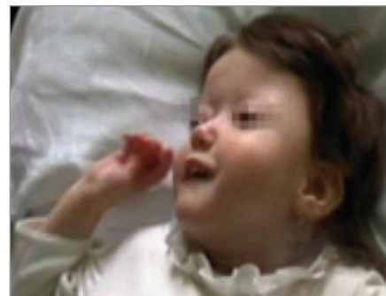
Obr. 3. Kraniofaciální abnormita u 2. pacientky – brachycefalie, hypoplazie střední obličejové části, asymetrie frontální oblasti, malá dolní čelist.

Neprospívání a obtížné polykání, které se během kojeneckého věku zhoršovalo, bylo v 1,5 roce řešeno perkutánní gastrotomií. Dívka měla časté respirační infekty a otitidy, proto byla v 1,5 roce provedena adenotomie. Podle anamnézy se poruchy nočního dýchání vyskytovaly již v batolecím věku, podrobnější vyšetření se však neuskutečnilo. Ve 3,5 letech byla hospitalizována pro opakované generalizované epileptické záchvaty, byla zahájena terapie primidonem. Během hospitalizace se rozvinul respirační infekce s poruchou dýchání ve spánku provázenou poklesy saturace hemoglobinu kyslíkem na 87 %, s nutností oxygenoterapie. PSG prokázala OSA těžkého stupně, s převažujícími hypopnoemi a s významnými desaturacemi (až k 60 %), obr. 4. Je pravděpodobné, že v důsledku akutního infektu došlo k akcentaci chronické ventilační poruchy ve spánku