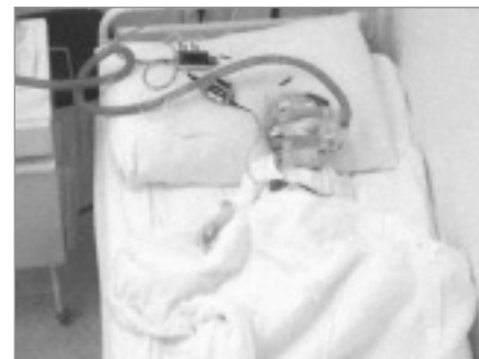
Obr. 2. Pacient č. 1 na terapii BiPAP během nočního spánku.

binace primidon, topiramát, fenytoin). V EEG byly patrné epileptiformní výboje nad pravým zadním kvadrantem s maximem temporálně. MRI mozku zobrazila postmaltickou pseudocystu komunikující s pravou postranní komorou. Ve 14 měsících se po opakovaných respiračních infektech objevilo během spánku výrazné chrápání, stridor, zástavy dechu s následným zatahováním, lapáním po dechu, kašlem a nauzeou. Během dne byl chlapec unavený, špatně polykal, přestal přibývat na hmotnosti. Před vyšetřením na našem pracovišti byla pro noční dechové potíže provedena řada vyšetření. Noční EEG videomonitorace nespovědila pro epileptický původ noční dyspnoe. ORL vyšetření nezjistilo významnou hypertrofii adenoidní vegetace ani tonzil, chirurgický výkon nebyl indikován, nález při laryngotracheobronchoskopii byl normální. Bylo provedeno kardiologické, alergologické a imunologické vyšetření (s nálezem hypogamaglobulinemie IgA). EMG vyšetření nespovědilo pro nervosvalové onemocnění. Jícnová pH-metrie prokázala gastroezofageální reflux (GER), který byl léčen omeprazolem a domperidonem bez efektu na noční potíže. Stejně tak byla bez efektu terapie inhalačními kortikoidy, perorálními bronchodilatancii a antihistaminiky. Po 4 měsících trvání potíží byla na našem pracovišti provedena noční polysomnografie (PSG) s nálezem těžké spánkové apnoe smíšeného typu, s převahou obstrukčních apnoí. Pravděpodobný byl podíl GER na vzniku noč-