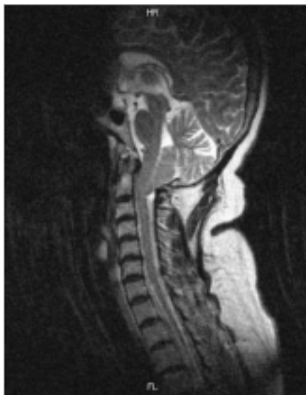
Obr. 3. MRI vyšetření 52leté ženy s Chiariho malformací typu I B.