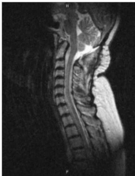
Obr. 4. kontrolní MRI vyšetření s odstupem 10 měsíců od operace.

Chiariho malformace typu I A se syringomyelií Th1–Th8. Provedena dVTO, laminectomie C1, C2, resekce tonzil, plastika dura mater.