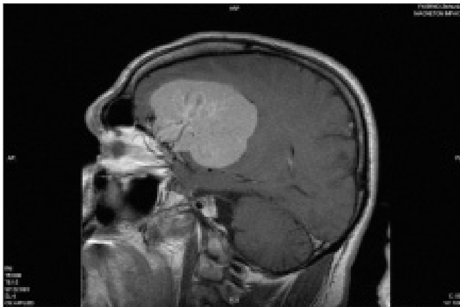
Obr. 1. Snímek MRI; sagitální řez s nálezem tumoru vyrůstajícího z báze přední jámy lební s bohatým cévním zásobením.

55letý muž, bez zátěže v rodinné i osobní anamnéze, uváděl asi 12 měsíců trvající bolesti hlavy, slabosti končetin a zhoršení zraku do dálky. CT vyšetření provedené v nemocnici v Kyjově prokázalo objemný tumor charakteru meningiomu fronto-temporo-parietálně vlevo s origem na bázi lební nad očníci a arachnoideální cystou temporopórně vpravo. Nález byl verifikován i magnetickou rezonancí (obr. 1). Pacient byl přijat na neurochirurgickou kliniku Fakultní nemocnice Brno, kde byla provedena v říjnu 2005 totální exstirpace tumoru. Dobře ohraničený tumor o rozměrech 8 × 6 × 6 cm expanzivně prorůstal do postranní komory, komunikace o rozměrech 2 × 2 cm vzniklá po exstirpaci tumoru byla překryta spongostanem. Operační výkon byl provázen krevní ztrátou 4 l, která vyplývala z charakteru nádoru. Jednalo se o velmi objemný mezenchymální bohatě vaskularizovaný nádor s odlišením na bázi lební. Po výkonu byl pacient na řízení ventilací. Třetí pooperační den byla provedena revize pro hematoma v operačním lůžku, po kontrolním CT. 7. pooperační den byl pacient odtlumen a převeden na spontánní ventilaci. 16. pooperační den